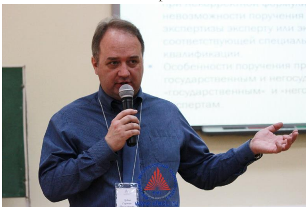
Лекция для следователей в Южном федеральном университете

Сотрудники АНО "КЛАД" являются сертифицированными преподавателями по использованию комплексов ИКАР-Лаб и ОТExpert и других программных средств криминалистического исследования фонограмм и видеофонограмм, и обладают большим опытом обучения как российских, так и зарубежных экспертов и адвокатов. Обучение проводится в форме лекций, семинаров и практических занятий, в т.ч. с использованием средств дистанционного обучения.