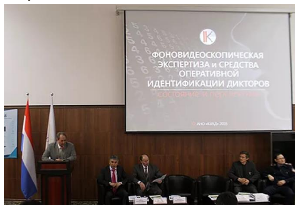
Лекция в КАЗГЮУ для экспертов и специалистов правоохранительных органов Республики Казахстан